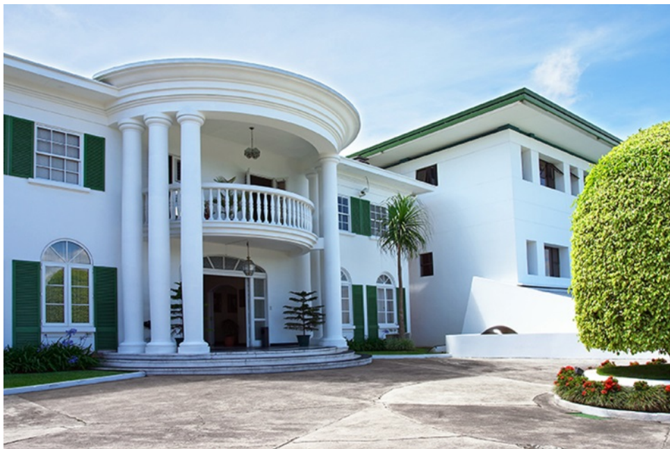
Corte Interamericana de Derechos Humanos

Esta decisión fue ratificada después por los Estados Partes en la Convención durante el Sexto Período Extraordinario de Sesiones de la Asamblea General, celebrado en noviembre de 1978. La ceremonia de instalación de la Corte se realizó en San José el 3 de septiembre de 1979.